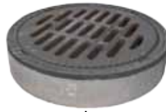
Einlaufgitter C250, D400 BEGU/GU