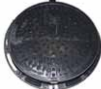
Abdeckung geschlossen D400 Vollguss