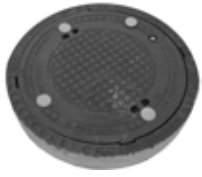
Abdeckung tagwasserdicht D400