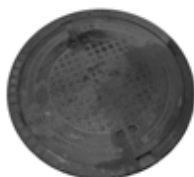
Abdeckung geschlossen B125, C250, D400 BEGU/GU